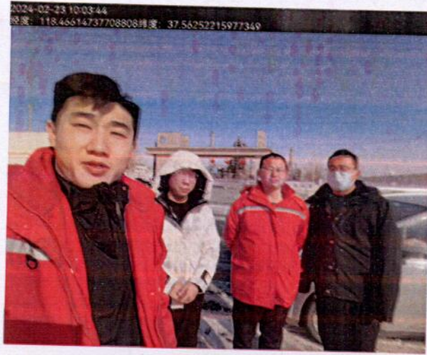
图 1 检测照片