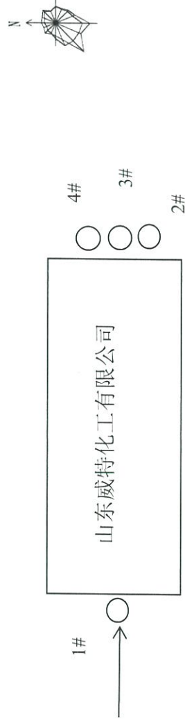
图 3-1 10月18日无组织废气检测点位分布图